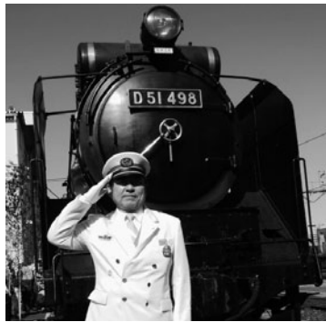
10年ぶりのSLと上野駅長

第49代池袋駅長を経て昨年第40代上野駅長に就任した。いずれも首都東京の巨大ターミナルだが上野駅に