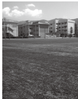
あがた多目的グラウンド

我々が高校を卒業した1984年、サッカー日本代表はオリンピックアジア予選を全敗で落とし、翌1985年は初のワールドカップ出場に最も近づくものの韓国に敗れ、本大会には出場できませんでした。私たちサッカーに関わるものにとつてワールドカップはあくま