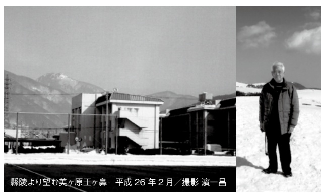
縣陵より望む美ヶ原王ヶ鼻 平成26年2月

美ヶ原高原を半世紀振りに訪れました。厳冬期に訪れたのは初めてでホテルのシャトルバスは、山辺から駒越林道を通り王ヶ頭のホテルまで直行、数日前の大雪で高原は白銀の世界となり、雪上車で美しい塔等高原の散策に、夜は満天の星空、朝のご来光、王ヶ