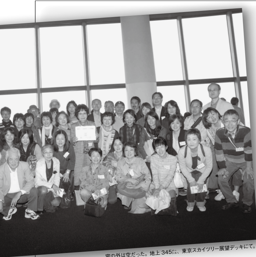
窓の外は空だった。地上345m、東京スカイツリー展望デッキにて。

身近で重要な防災について、楽しみながら学び体験できるといって、とてもよい企画だったと感じています。役員らしいことができず申し訳なかったですが、皆さんの笑顔に触られたことがとても幸せでした。