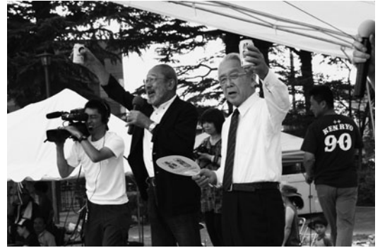
創立90周年「大縣陵祭」、一斉乾杯の瞬間 あがたの森にて

機械的に、かつ自動的にものを生産するのと違って、季節季節の小さな作業の繰り返しで年に1回の秋の爽りを楽しんでおります。それに加えて嬉しい事に田んぼの水源のせせらぎにホタルが戻ってきました(石川丸山谷戸で検索)。6月初旬、住宅地のはずれにホタルの大乱舞がみられます。少々有名になり、ギャラリーの増加に伴いマナー違反者に頭を悩