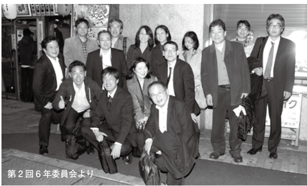
第2回6年委員会より