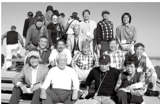
地球の丸く見える丘展望台にて縣陵勢 15名、最後列右から3人目が筆者

中信地区十一校が集う親睦旅行は、学校や年代を越えた『同郷の仲間』としての心が通い合い、宴会も車中も楽しいひと時を過ごしました。特に今回は「ふるさとは今もかわらず」「花は咲く」などの合唱で盛り上がりました。次回の幹事校は松本工業と豊科です。