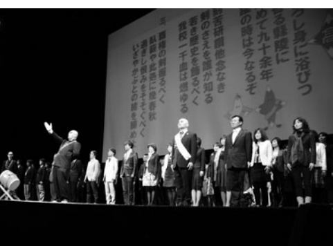
2013年4月「母校愛のリレー」より

し、独自の社会貢献活動を行い、講演会を開催するだけでなく、我々も母校への恩返し、社会貢献を行いたい。また、その姿が在校生へのメッセージとなれば、さらにうれしい。