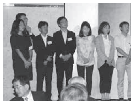
2014年東京同窓会より、47回実行委員長から48回実行

多くの先輩、後輩、同期の皆様は協力や仰ぎ、多くの先輩、後輩と語り、大いに笑い大いに楽しむ、そんな同窓会を目指