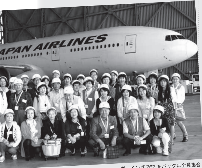
ボーイング767をバックに全員集合!

出迎えのご挨拶も感じよく、まずは航空教室。整備士、運航乗務員、客室乗務員などの経験者が担当して、それぞれの経験を生かした説明をしてくださいました。皆さん定年後のボランティア