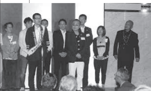
委員会へたすきリレーの一場面

多くの先輩、後輩と語り、杯を傾けることができます。そしてそれは今後の大きな財産となつて、皆様の人生を必ず