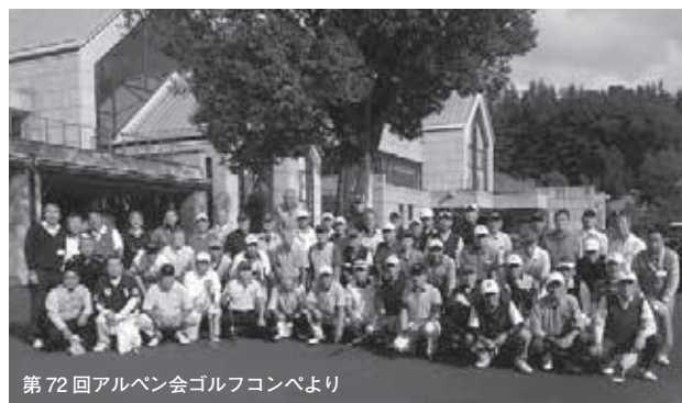
第72回アルペン会ゴルフコンペより

第71回アルペン会ゴルフコンペ 開催日：平成26年4月10日(木) 会場：越生ゴルフクラブアルペン会ハンディ戦 参加数：54名 天候：快晴後曇り